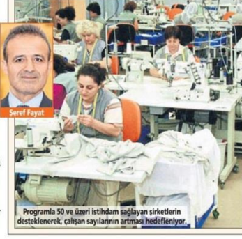
Programla 50 ve üzeri istihdam sağlayan şirketlerin desteklenerek, çalışan sayılarının artması hedefleniyor.

■ Bu uygulamanın hayata geçirilmesi ile birlikte 50 ve üzeri çalışan sahip firmaların üretimi desteklenecek ve istihdamlarının ömü artacak. ■ Mali yükler nedeniyle istihdamlarını artırmayan şirketler sağlanan kolaylıkları yatırıma ve istihdamına yönelecek. ■ Kayıtdışı 800 bin kişi devletten 800 milyon TL gelir sağlanacak. ■ 2023 için konulan 60 milyar dolarlık ihracat hedefi hayalden gerçeğe dönecek.