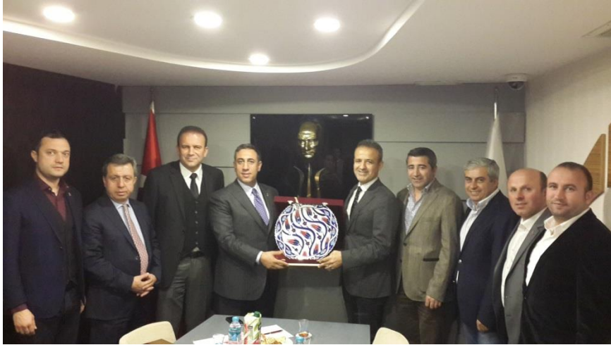
25 Mart 2015 - LASIAD Başkanı Gıyasettin Eyyüpkoca ziyaret edildi.

TGSD Yönetim Kurulu Başkanı ve Yönetim Kurulu Üyelerinin katıldığı görüşmede, sektörün iki büyük sivil toplum kuruluşunun birlik ve beraberlik içerisinde çalışmasının gerekliliği vurgulandı. OTİAD (Osmanbey Tekstilci İşadamları Derneği)'ın iş modeli ve hızı ile örnek sivil toplum kuruluşlarından biri olduğu fuar ve etkinliklerde birbirine destek olması kararlaştırıldı.