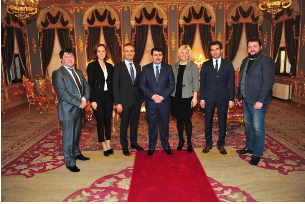
23 Şubat 2015- İstanbul Valisi Sn. Vasip Şahin ziyaret edildi.