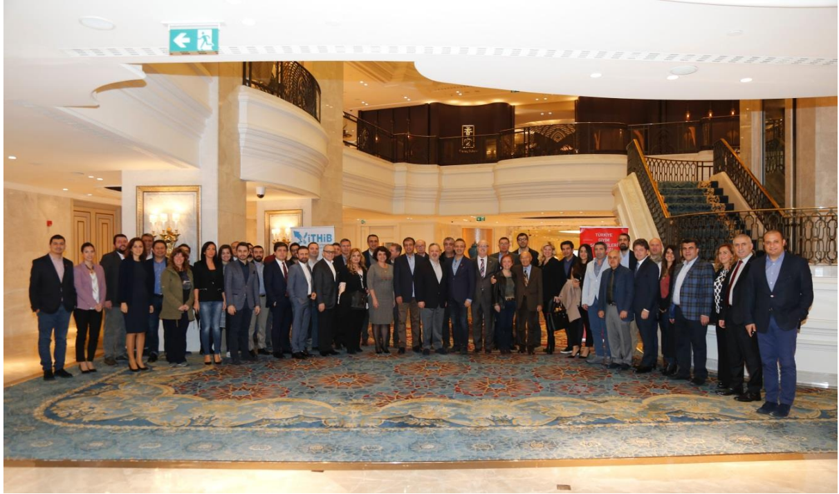
28 Mart 2015 TGSD-İTHİB Ortak Akıl Toplantısı düzenlendi.